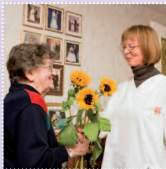
Rundherum gut versorgt mit dem Evangelischen Pflegedienst München e.V.